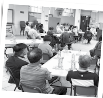
「老謀深算」政府福利講座